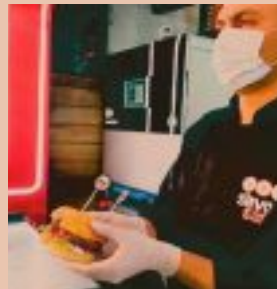
המבוזר של סבוריט