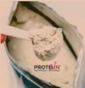
אבקת חלבון של נקסטפרם