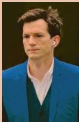
אשטון קוצ'ר, הצטרף לאחרונה להשקעה במיטק